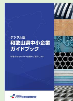
和歌山県中小企業WEBガイドブック